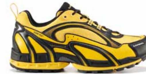
Mit einem GORE-TEX®-Futter ausgestattet ist der LOWA Herren-Speedhiker S-TRAIL GTX®. Er bringt 360 Gramm (UK Größe 8) auf die Waage und ist in vier Farbstellungen zu haben.