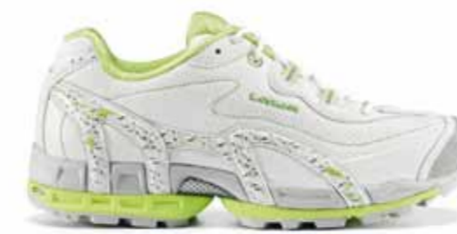
Leicht, schnell, stabil: Der LOWA Damen-Speedhiker S-COPE Ws. Das in zwei Farbstellungen lieferbare Modell wiegt 310 g in Größe UK 5.