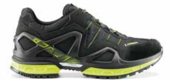
Als Hybrid bezeichnet LOWA seinen Speedhiker GORGON GTX® mit Monowrap-Sohlenkonstruktion, der teils Lauf-, teils Wanderschuh ist.